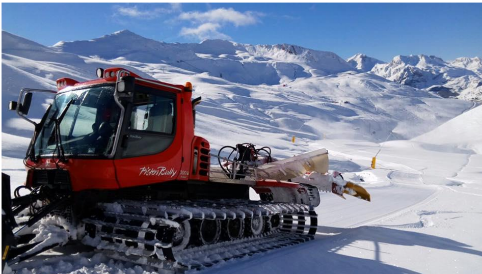
Astún, foto 26 de noviembre

Junto a esto se podrá disfrutar de un exclusivo circuito de conducción en nieve ubicado en pleno corazón de las pistas a 2000 metros de altura . Un lugar aparentemente imposible para la circulación rodada. El Snow Park o una oferta gastronómica diversa y de auténtico nivel complementan las peculiaridades del nuevo 100K.