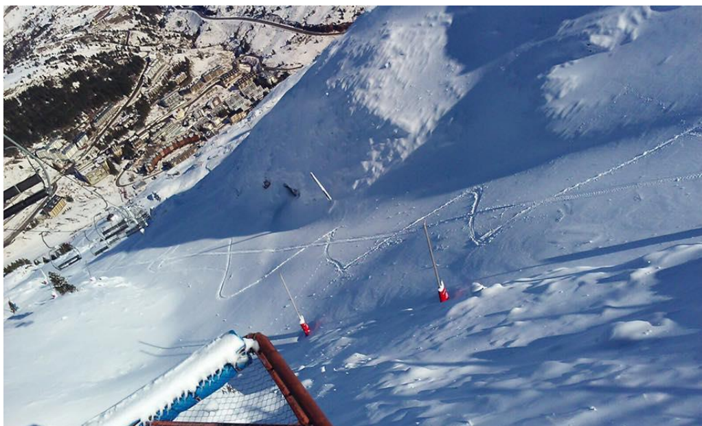
Candanchú, foto 27 de noviembre

El próximo viernes día dos de diciembre, dará comienzo la temporada de nieve 2016-2017 en el Valle del Aragón . Un invierno que trae como novedad la alianza de dos grandes del mundo del esquí, Candanchú y Astún . Lo hacen bajo la marca 100K y supone poder dar una oferta a los clientes haciéndolas más competitivas y atractivas.